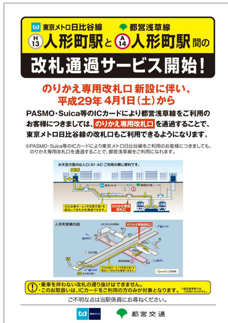
人形町駅に掲出するお客様告知用ポスター(イメージ)