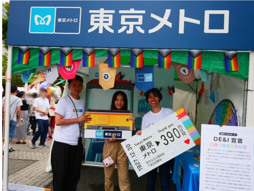
昨年度のブースの様子

(昨年の様子: TEAM Tokyo Pride | TEAM メトローカル | 東京メトロ )