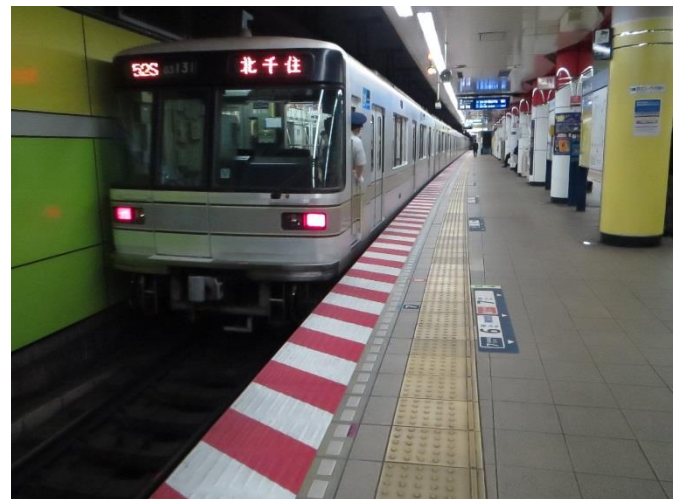
「注意喚起シート」設置状況（日比谷線仲御徒町駅）