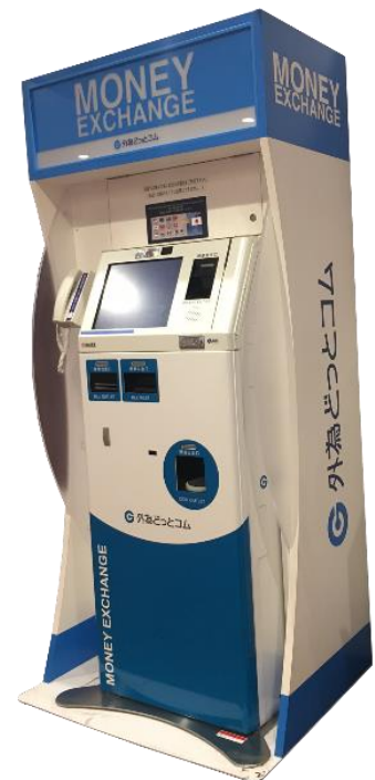
外貨自動両替機イメージ