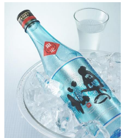
奥の松酒造 吟醸原酒