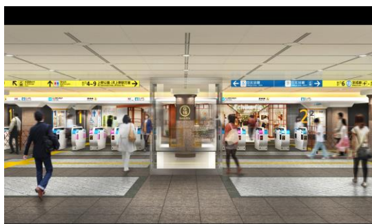
<上野駅改札イメージパース>