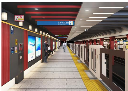
<浅草駅ホームイメージパース>