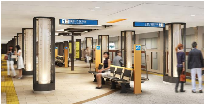
＜神田駅ホームイメージパース＞