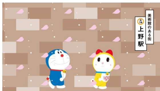
<CM上野駅イメージ～美術館のある街～>