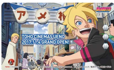
「BORUTO」オリジナルLED+ICカードケース

※映画観賞割引券は2017年12月9日（土）から2017年12月31日（日）までご利用いただけます。