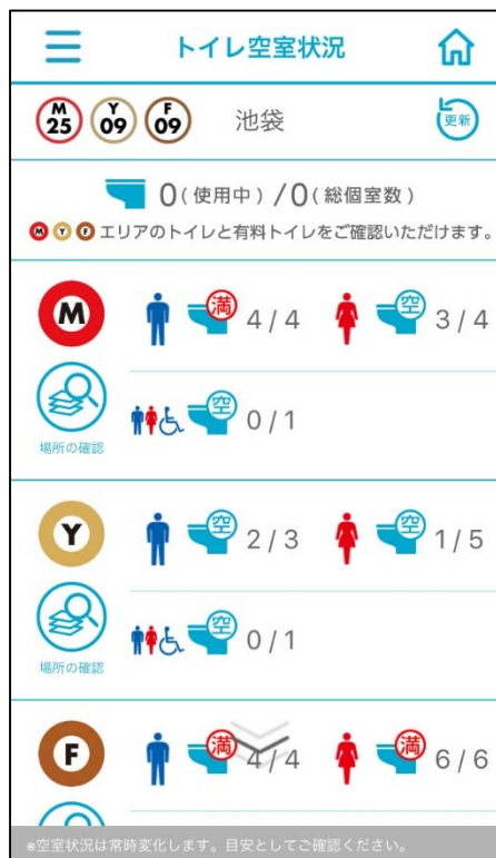
【トイレ空室状況】画面イメージ