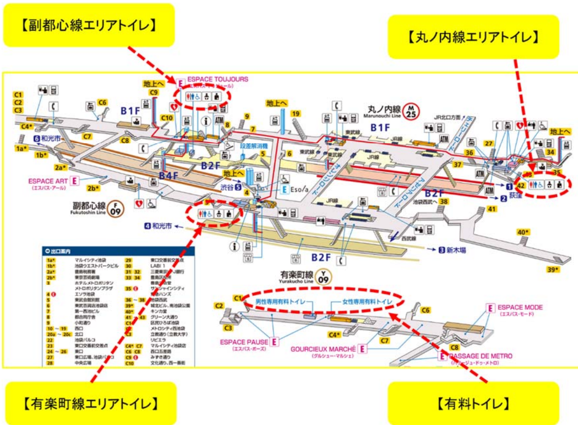
東京メトロ池袋駅 構内図