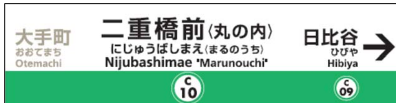
駅名標イメージ図

（※）一部駅名標や車内案内装置等においては更新作業の都合上、表示開始時期が前後する場合がございますので、予めご了承ください。