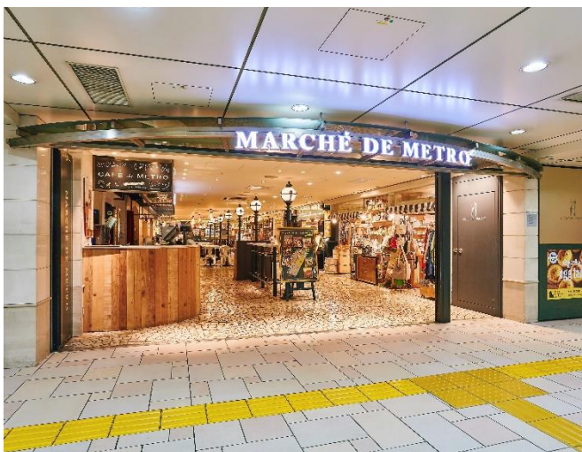
Echika 表参道 マルシェ・ドウ・メトロ