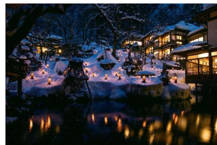
東山温泉の向瀧(会津若松市)