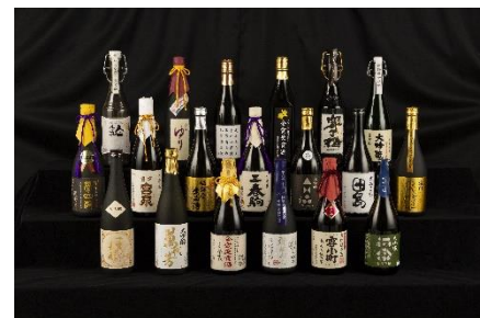
全国新酒鑑評会で金賞を受賞した福島の日本酒