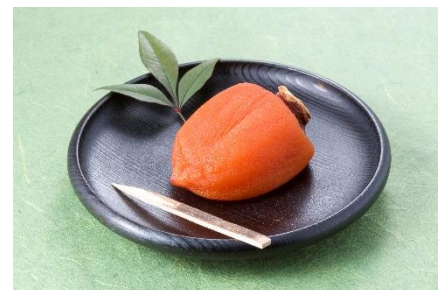
カリウムやビタミンCなどの栄養素を豊富に含む「あんぼ柿」

福島県の観光案内パンフレットを配布し、福島の温泉や、鶴ヶ城などの観光名所等の観光PRを実施します。また、多言語パンフレットもご用意し、海外のお客様のご来場もお待ちしております。