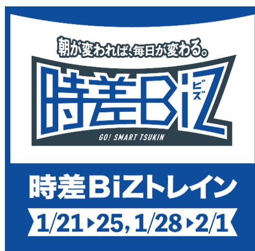
東西線時差 Biz トレインヘッドマーク(イメージ)