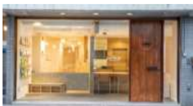
room EXPLACE 外観

詳細は、「room EXPLACE」特設Webサイト ( https://roomexplace.jp/ ) をご覧ください。