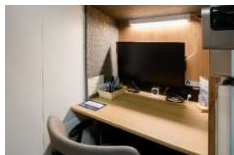
ワークブース内観（南北線溜池山王駅構内）