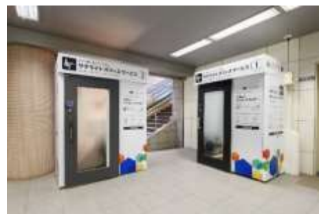
ワークブース外観（南北線溜池山王駅構内）