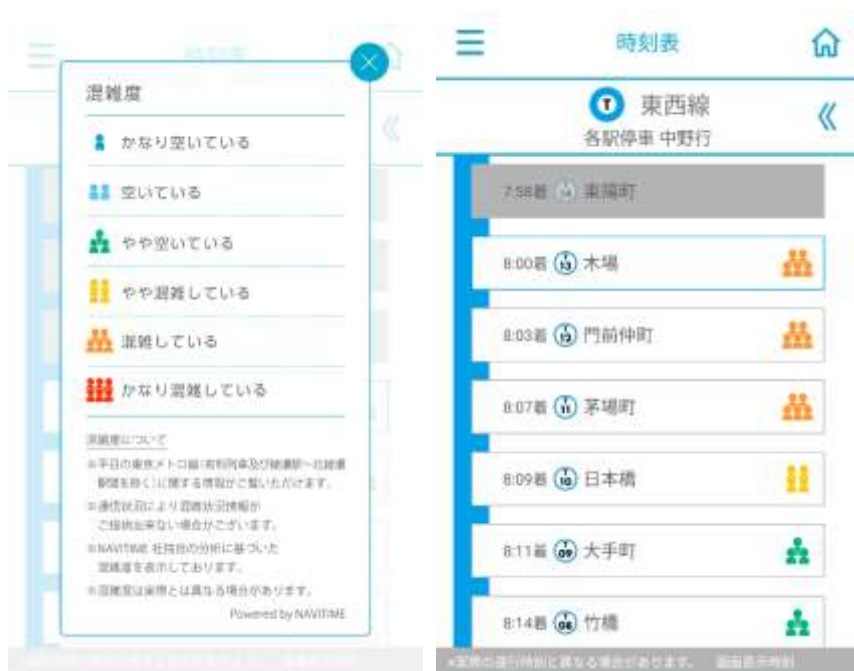
東京メトロアプリ画面

また、東西線の西船橋～木場駅間、南北線の赤羽岩淵～後樂園駅間及び千代田線の綾瀬～新御茶ノ水駅間については、駅ごと、列車ごと、車両ごとの平日朝の混雑状況を東京メトロホームページにてお知らせしています。