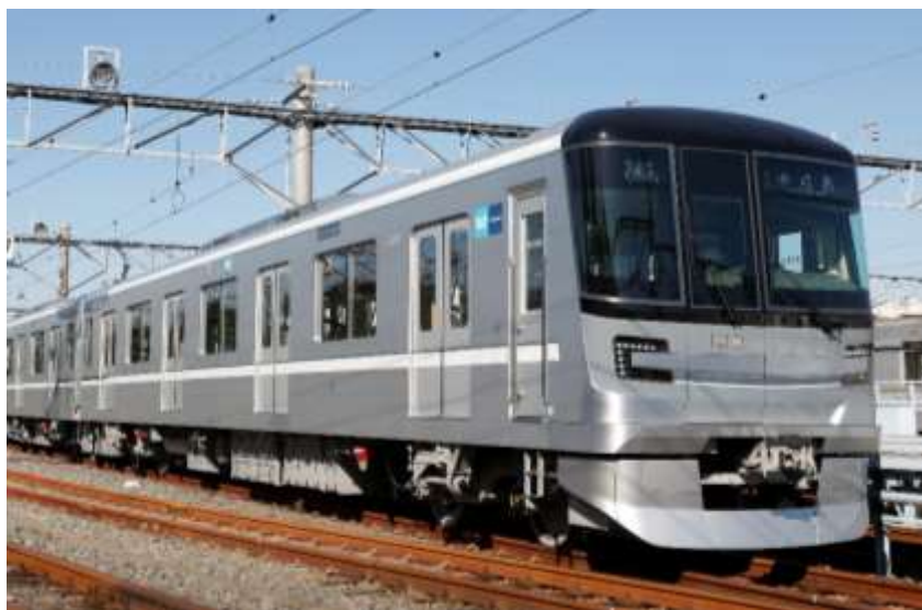
臨時列車として運行する日比谷線 13000 系

「スムーズBiz」に合わせて実施する混雑緩和に向けた取組みの詳細は、別紙のとおりです。