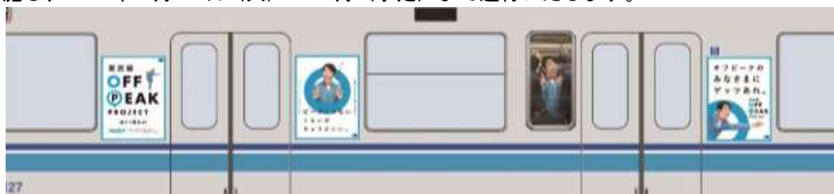
ラッピング車両イメージ

さらに、東西線車両の一編成限定で東西線オフピークプロジェクト専用のラッピングを施し、2019年7月16日（火）～10月（予定）まで運行いたします。