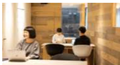
room EXPLACE 内観