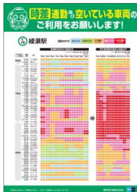
千代田線混雑状況