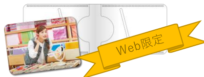
オリジナルパスケース(イメージ)