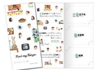
A セット専用台紙(イメージ)