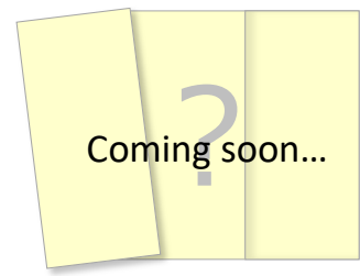
B セット専用台紙(イメージ)