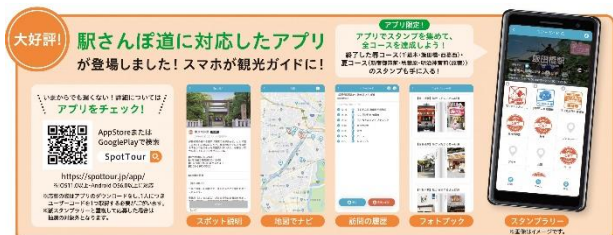
アプリ限定スタンプラリー (春・夏コース)