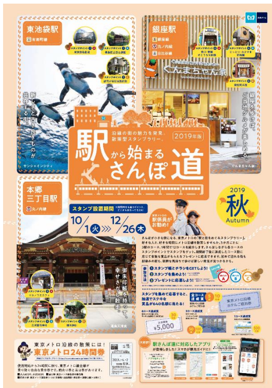
告知ポスター (2019年10月1日～12月26日 実施分)