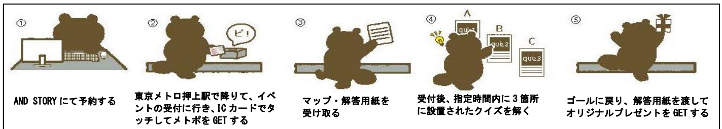
メトポの進呈、及びイベントの流れ