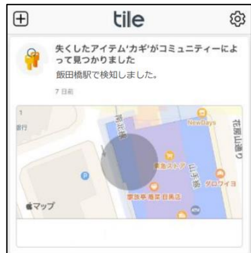
お客様への通知イメージ