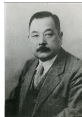
地下鉄の父 早川徳次