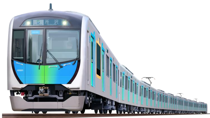
有料座席指定列車「S-T R A I N」