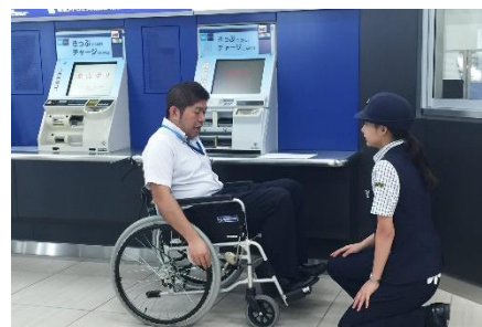
バリアフリーに関する研修の様子

さらに、車いすをご利用のお客様など、お身体の不自由なお客様にも円滑に駅をご利用いただけるよう、大会期間中、主要駅ではエレベーターの上下乗入口近くに人員を配置し、車いすをご利用のお客様などが優先的にご利用いただけるよう、ご案内いたします。