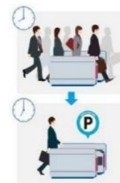
メトポのオフピークポイント導入

2019 年 4 月から、メトポのサービスにオフピークポイントを導入し、現在オフピークキャンペーンを実施している東西線や豊洲駅等において、お客様にオフピークポイントを進呈する取組みを行います。