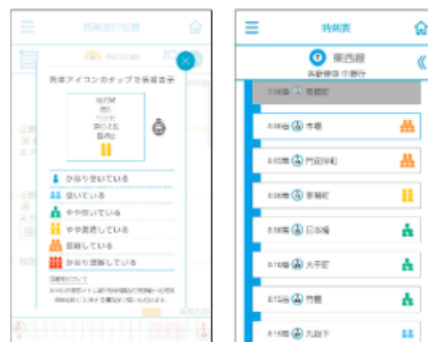
東京メトロアプリ混雑見える化