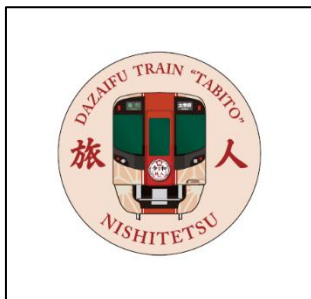
西鉄ピンバッジ (イメージ)