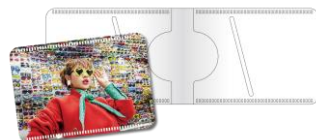
Aセットオリジナルパスケース (Web限定)