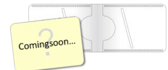
Bセットオリジナルパスケース (Web限定)

※このニュースリリースは、国土交通記者会、ときわクラブ、都庁記者クラブ、レジャー記者クラブにお届けしています。