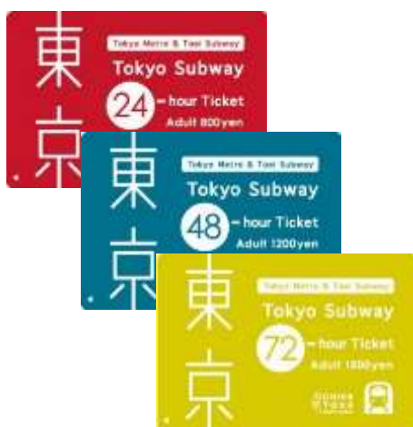
Tokyo Subway Ticket