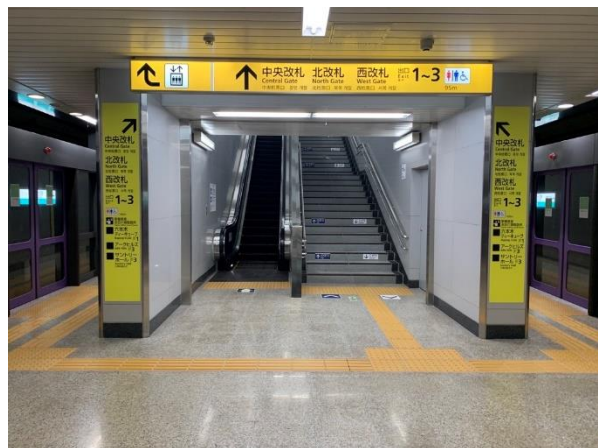
六本木一丁目駅で新たに設置した エスカレーター・階段