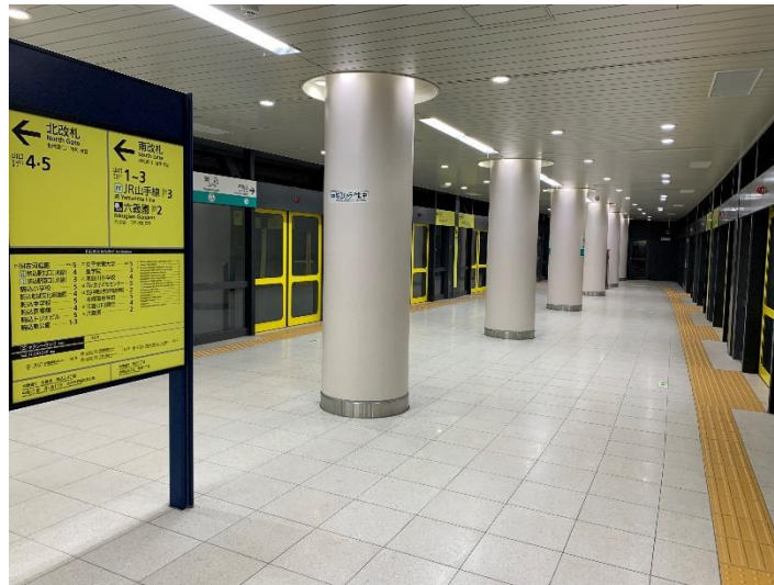
駒込駅ホーム延伸部