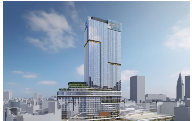
計画建物（イメージ）

新宿駅西口に位置し、敷地面積約1.6万㎡を活用して計画する建物の延床面積は約28.2万㎡です。地上48階建てで、高さは約260m、高層部にはハイグレードなオフィス機能、中低層部には新たな顧客体験を提供する商業機能を備えます。オフィス機能と商業機能の中間フロアには新宿の特性を生かして来街者と企業等の交流を促すビジネス創発機能を導入しイノベーションの創出を図るとともに、低層部にはビジネス創発の情報や新宿をはじめとした小田急沿線、東京メトロ沿線等の情報を発信する機能を設けます。