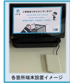
各箇所端末設置イメージ