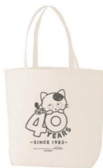
【C賞 オリジナルトートバッグ(非売品)】