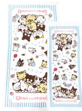
【B賞 バスタオル&フェイスタオルセット】