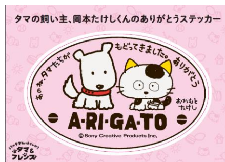
達成賞 オリジナルステッカー