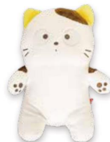
Wチャンス賞 A賞 もっちりタマ