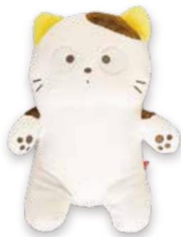
【A賞 もっちりタマ(サイズ約33cm)】