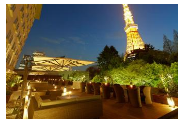
カフェ&バー タワービューテラス

さらにオープン期間中、東京プリンスホテルではお得なコラボレーションを実施いたします。1名様1万円*でナイトプールと宿泊をお楽しみ頂ける「CanCamスペシャルステイプラン」の他、様々なコラボ宿泊プランを順次ご用意。また、今年4月に新規オープンした、東京タワーが目前に広がるテラス席でくつろぎのひと時を過ごせる東京プリンスホテル3F「カフェ&バー タワービューテラス」（営業時間10:00～21:30）では、『CanCam』とコラボレーションしたオリジナルメニューを販売いたします。さらにナイトプールチケットの半券提示で一部レストランなどが10%OFFでお楽しみいただけます。詳細は随時ナイトプールの公式サイトよりご案内させていただきます。