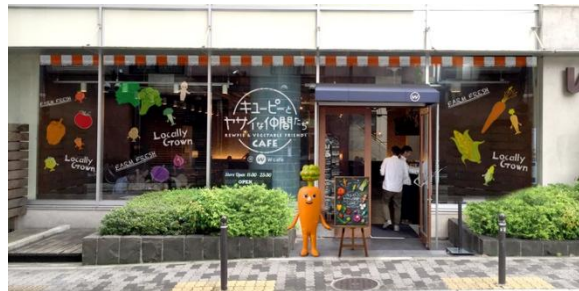
店舗外観/左:東京、右:大阪(写真はイメージです)