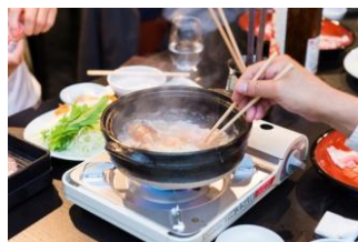
お酒飲めない方々へも、日本酒の魅力を違った形で味わって頂けます。