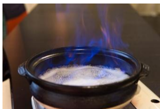
日本酒のアルコールを飛ばし、アルコール0%のうまみ成分＝アミノ酸汁が完成します。