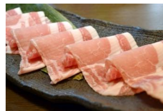
銀座蔵麴豚 麴を与えて飼育された臭のない美味しい豚肉を提供します。