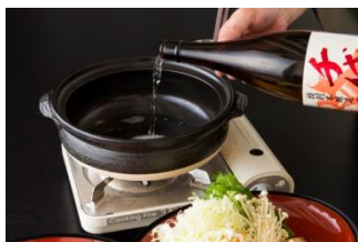
日本酒100%しゃぶしゃぶ 日本酒の種類はお好みに合わせてお選び頂けます。

300年以上続く希少な酒蔵としゃぶしゃぶが融合し、アミノ酸たっぷりの日本酒100%しゃぶしゃぶをご提供します。日本酒が沸騰蒸発するとアルコールが飛び、うまみ成分＝アミノ酸汁となり、食材のうまみを引き出すことができます。お酒飲めない方々へも、日本酒の魅力を違った形で味わって頂けます。また、より楽しんで頂けるよう、酒粕・麴・ココナッツバージンオイル・薬膳・イタリアントマト・グリーンカレーなど種類豊富なフレーバーをご用意しております。