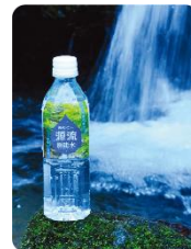
【プレゼントイメージ】