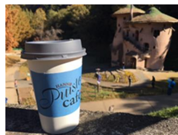
【テイクアウト イメージ】