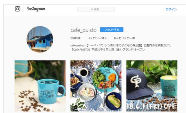
【Café PUISTO instagramイメージ】