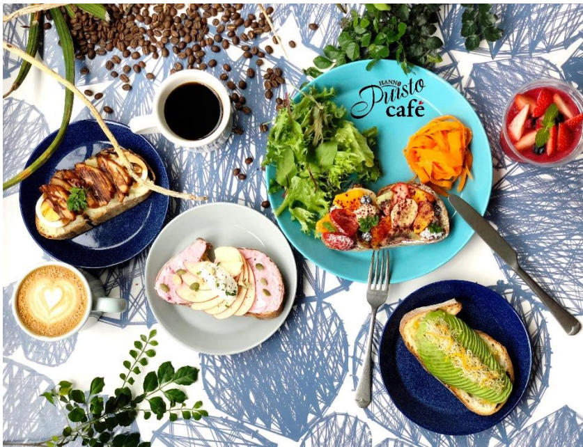
【メインビジュアル：SMORREBROD 1plate LUNCH】

トーベ・ヤンソンあけぼの子ども森公園 https://www.city.hanno.lg.jp/akebono