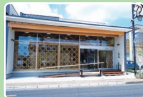
景品対応時間9時～16時

スタンプラリーを選択し、飯能市内のスタンプスポットに設置されたQRコードを読み取ると、アプリ内の画面に電子スタンプが表示されます。