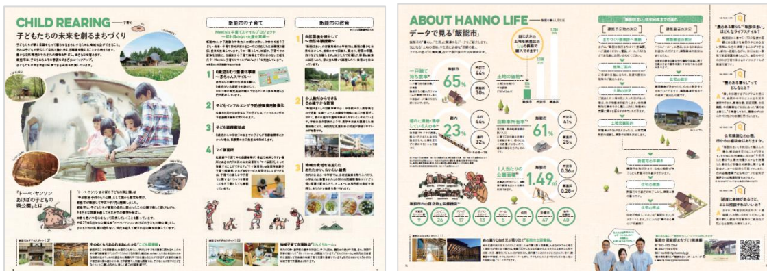
移住ガイド『“農のある暮らし”「飯能住まい」』【中面イメージ】

配布場所 埼玉県移住相談窓口「住むなら埼玉移住サポートセンター」など (東京都千代田区有楽町2丁目10-1 東京交通会館8F)