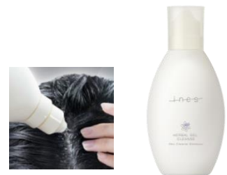
<ダイレクトアプリケーション>