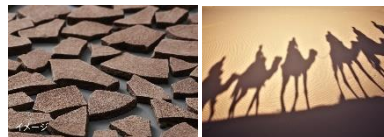
雄大な山々、美しい砂漠のあるモロッコの天然クレイ (ガッスールクレイ)を含むクレイ美容成分※3を配合しました。