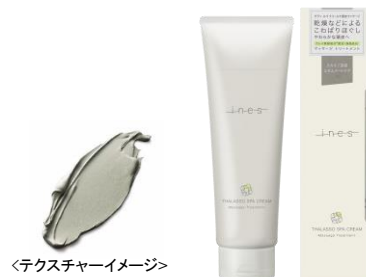
<テクスチャーイメージ>