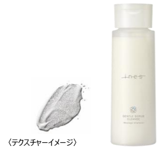
(テクスチャーイメージ)

※1 ブルターニュ産海塩・コーンスターチ・セルロース・ フルオロケイ酸 (Mg/K) ・ (マレイン酸/ビニルアルコール) コポリマー-Na (洗浄助剤)