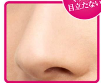
皮脂くずれ防止 化粧下地を使用