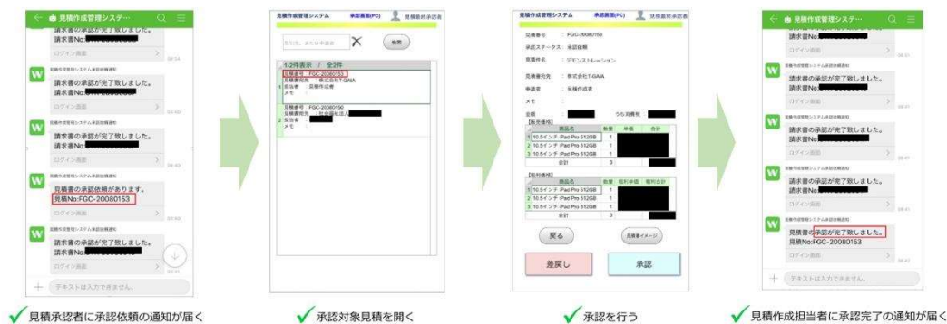
見積書作成管理システムとの連携イメージ

るようにしたことで、見積書の承認に要する速度が大幅に向上しました。従来は顧客に見積書を送付するまでに2~3営業日ほどを要していましたが、承認フローが円滑化したことで、作成作業に着手してから数時間で送付できるようになりました。また、受付システムともAPI連携を行い、来客通知を担当者のトークに発信する仕組みを構築。受付での電話対応がなくなるなど、業務効率向上を実現しています。