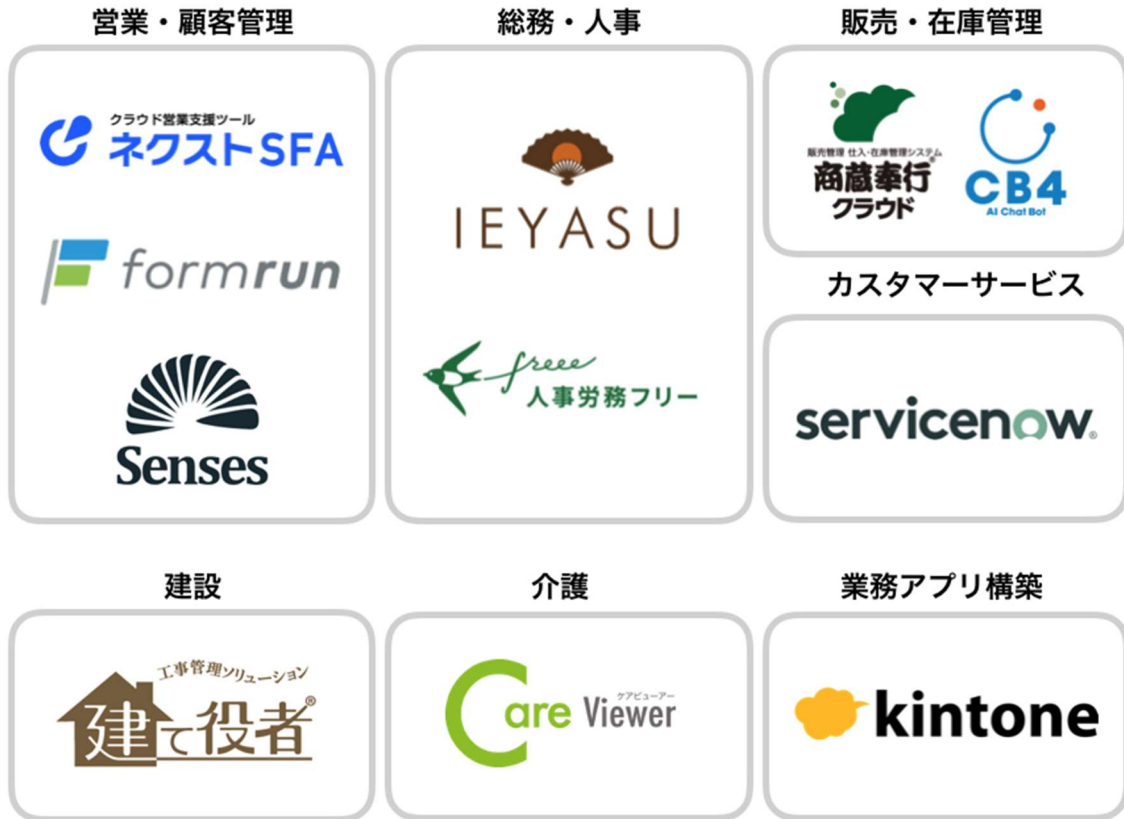
2020年に連携した主なソリューション

「LINE WORKS」は外部の様々なサービスやソリューションと連携することで、利用者の業務効率化を支援しています。このたび、「LINE WORKS」と連携するソリューションの数が100製品を突破いたしました。