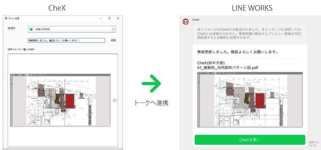
▲「CheX」から「LINE WORKS」へ連携した際の画面イメージ