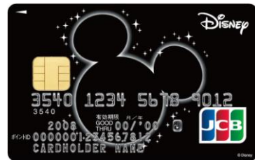
ミッキー・マウス(ブラック)