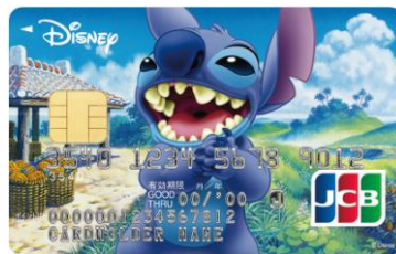
スティッチ(アイランド)