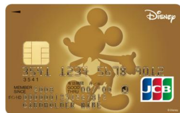
ミッキー・マウス(ゴールド)