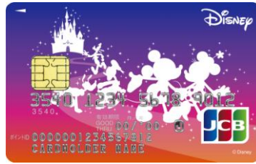
ファンタジックパレード(2016年6月30日受付分まで)