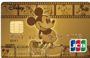
ミッキー・マウス&フレンズ