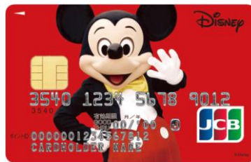
ミッキー・マウス(レッド)