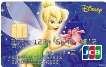
ティンカー・ベル