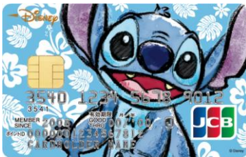
スティッチ(ハイビスカス)