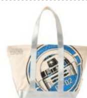
トートバッグ スター・ウォーズ R2-D2 / 4,212円(税込) /ディズニーストア

ディズニーストアのスター・ウォーズグッズは、夏の家族旅行やお出かけにもぴったりです。