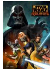
「スター・ウォーズ 反乱者たち」

CS 放送ディズニーXD で放送中のTV アニメーション・シリーズ「スター・ウォーズ 反乱者たち」も見逃しません。