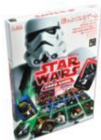
スター・ウォーズ カードゲーム (頭のよくなるゲーム)/2,160円(税込)/学研プラス