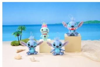
■スティッチ マスコット