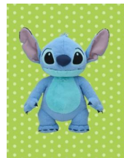
■スティッチ マックスジャンボ ふんわりぬいぐるみ