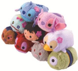
■TSUM TSUM S サイズ 各¥600