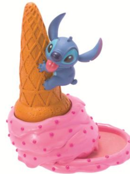
■アクセサリースタンド ¥3,000