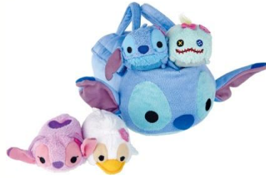
■TSUM TSUM バッグセット ¥3,500