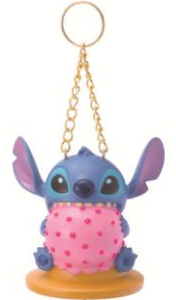
■ウィンドチャイム ¥3,000