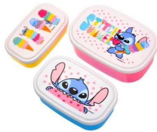
■ランチボックスセット ¥1,500