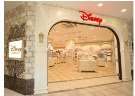
ディズニースタア原宿アルタ店

ウォルト・ディズニー・ジャパンでは、大人の女性をメインターゲットに“大人ディズニー戦略”を進めています。ディズニースタアでは、日本オリジナルデザインの店舗を2012年にオープンしました。全世界のディズニースタアは、共通の店舗デザインで統一されていますが、この店舗は白を基調とし、お城をイメージさせる空間やバラのモチーフがデザインされているなど、大人の女性にゆっくりお買い物を楽しんでいただける空間です。商品も、ジュエリー、コスメ、バッグなど、大人の女性のライフスタイルにあった日本オリジナル商品を数多く取り揃えており、ディズニースタアでしか味わえない、エンターテイメントショッピングを提供しています。