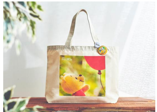
トートバッグ & 缶バッジ 2 個セット 4,500 円 (税抜)

間もなく訪れる「はちみつの日」に向けて、オンライン店だけで販売する貴重なアイテムにぜひご注目ください。