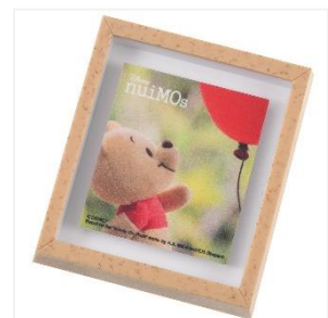
マグネット 500円（税抜）

ぬいもーずのぬいぐるみをデザインした、これまでにないオリジナルアイテムが登場。デザインに使用した写真の数々は、ランウェイを歩くミッキーマウスや、鏡の前でポーズを取るミニーマウス、仲間たちと顔をのぞかせているくまのプーさんなど、ぬいもーずのキュートな瞬間が撮影されています。