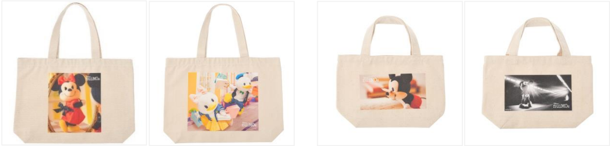
トートバッグ (大) 各 3,900 円 (税抜)