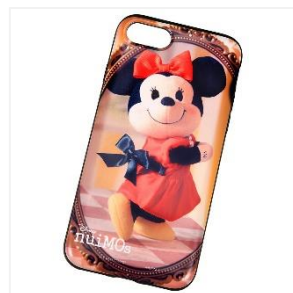
iPhone 7/8 用スマホケース 3,900円（税抜）