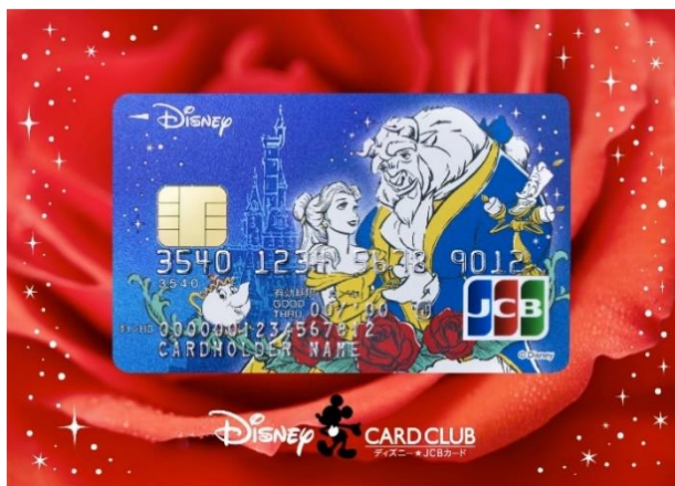
写真は美女と野獣（Web限定）です。