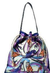
トートバッグ 3,960 円