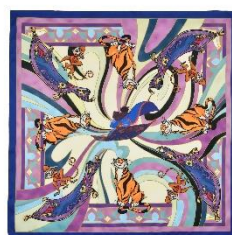
スカーフ 2,970 円