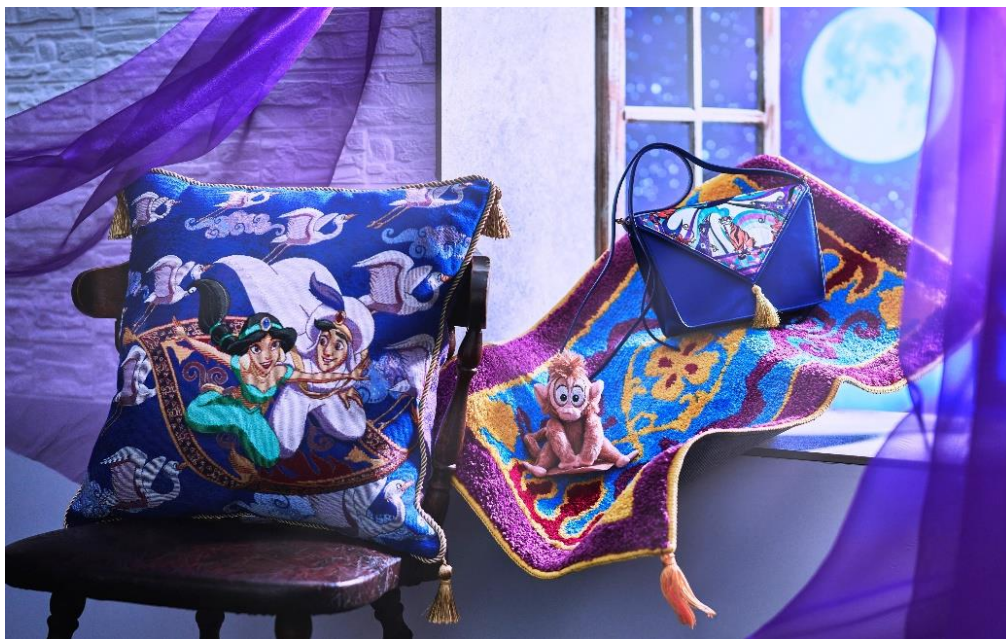
【画像掲載商品】 クッション 4,840 円 ラグマット 3,630 円 肩のりぬいぐるみ 2,750 円 ショルダーバッグ 3,960 円

▶ 特集ページ： http://shopDisney.jp/aladdin/2022/new/