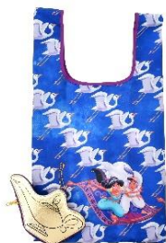
エコバッグ 2,640 円