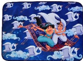
ブランケット 3,080 円