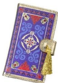
多機種対応スマートフォンケース 3,520 円