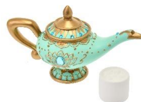
アロマディフューザー 4,400 円