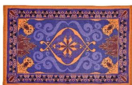
バスタオル 3,960 円