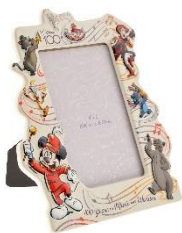
フォトフレーム 4,180 円