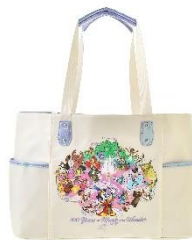
トートバッグ 4,950 円