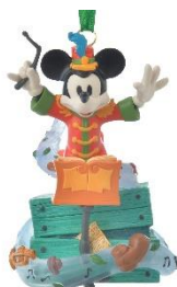
オーナメント 3,080 円