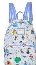
【Loungefly】バックパック 13,200 円