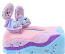
ティッシュボックスカバー 4,400 円