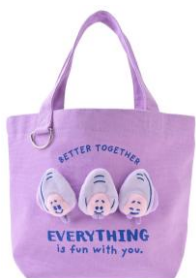
トートバッグ 3,900 円