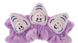
ヘアターバン 3,000 円