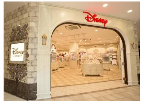
ディズニーストア原宿アルタ店

ウォルト・ディズニー・ジャパンでは、大人の女性をメインターゲットに“大人ディズニー戦略”を進めています。ディズニーストアでは、日本オリジナルデザインの店舗を2012年にオープンしました。全世界のディズニーストアは、共通の店舗デザインで統一されていますが、この店舗は白を基調とし、お城をイメージさせる空間やバラのモチーフがデザインされているなど、大人の女性にゆっくりお買い物を楽しんでいただける空間です。商品も、ジュエリー、コスメ、バックなど、大人の女性のライフスタイルにあった日本オリジナル商品を数多く取り揃えており、ディズニーストアでしか味わえない、エンターテイメントショッピングを提供しています。